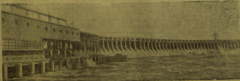
Днепрогэс. Общий вид днепровской плотины (август 1948 года). Фото Н. Крылова.

Подъем фрегата ведут водолазы команды товарища Жевакина. Уже подняты блоки, чугунный килос с надписью: «Паллада», Санкт-Петербург», дверные стойки, части медной обшивки, пушечный лафет. Работы закончатся в октябре. (ТАСС).